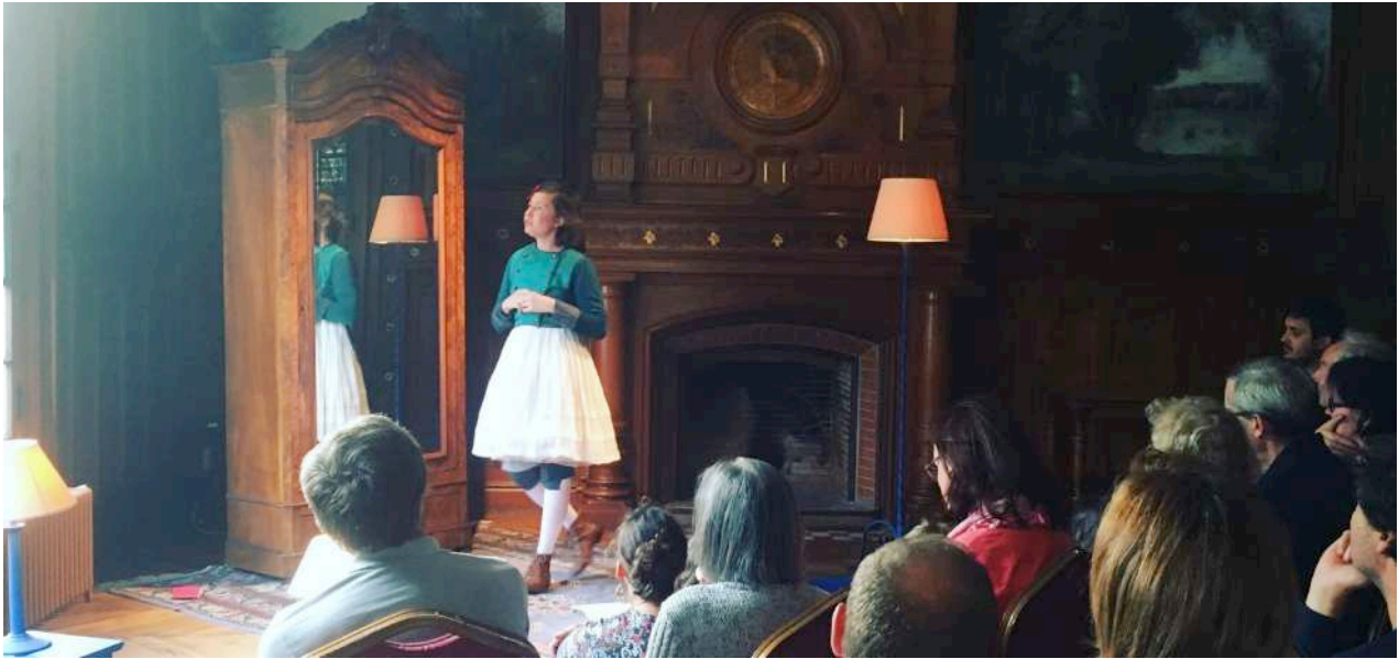
Vaux sur Seine 2016