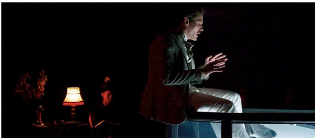
La Générale 2014